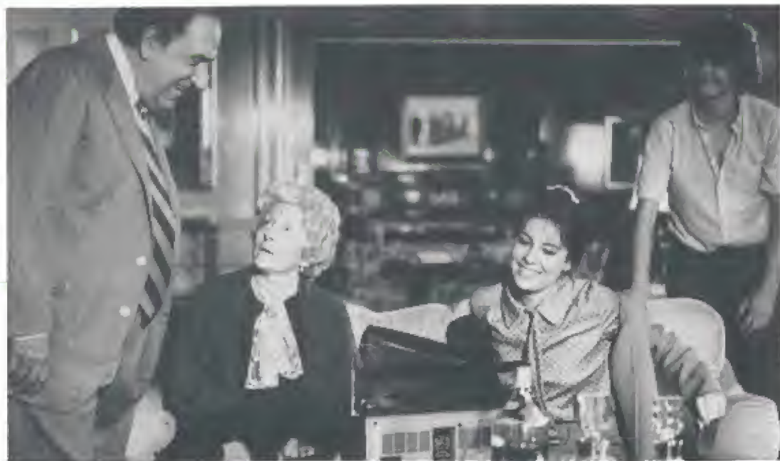
José Bódalo - Irene Gutiérrez Caba